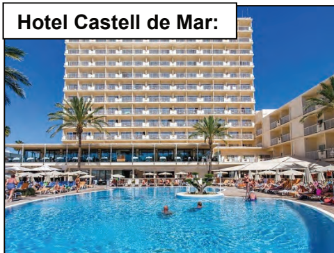
Hotel Castell de Mar:

Hotel Castell de Mar **** / Hotel Playa del Moro ****